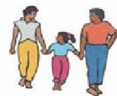
Familienwanderung Mai 2019