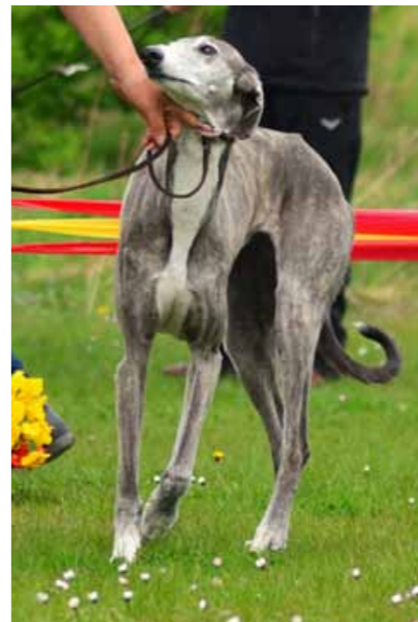
Dona Juanita of little Milwaukee (Brio Bandolero del Niños Vencedores - Chispa Priesa del Niños Vencedores) Z: Ingrid Reuser | B: Nicole Völkel- Halilovic, DE „Siegerin Gebrauchshundklasse“