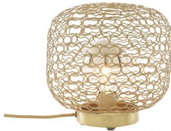
TISCHLEUCHE OPALGLAS WEISS

Eine Vase bestehend aus Opalglaskugel und Messinggitter-Kugel mit gleichen Formen ist ebenfalls erhältlich (siehe Kapitel Deko-Accessoires).