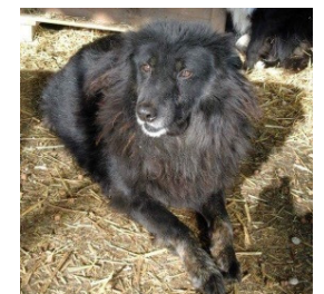
Bobby , Rüde, 15 kg Rumänien