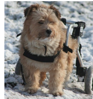
Teddy , Rüde, gelähmt, 9 kg schwer, Deutschland