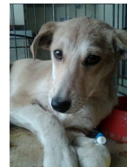
Magali (Links), Hündin, verheilter Beckenbruch 13 kg schwer Rumänien