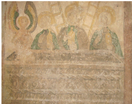
Die drei Frauen am leeren Grab - Malerei in der Rossower Kirche

Als der Sabbat vorüber war, kauften Maria aus Magdala, Maria, die Mutter des Jakobus, und Salome wohlriechende Öle, um damit zum Grab zu gehen und Jesus zu salben. Am ersten Tag der Woche kamen sie in aller Frühe zum Grab, als eben die Sonne aufging. Sie sagten zueinander: Wer könnte uns den Stein vom Eingang des Grabes wegwälzen? Doch als sie hinblickten, sahen sie, dass der Stein schon weggewälzt war; er war sehr groß. Sie gingen in das Grab hinein und sahen auf der rechten Seite einen jungen Mann sitzen, der mit einem weißen Gewand bekleidet war; da erschraken sie sehr. Er aber sagte zu ihnen: Erschreckt nicht! Ihr sucht Jesus von Nazaret, den Gekreuzigten. Er ist auferstanden; er ist nicht hier. Seht, da ist die Stelle, wo man ihn hingelegt hatte. Nun aber geht und sagt seinen Jüngern, vor allem Petrus: Er geht euch voraus nach Galiläa; dort werdet ihr ihn sehen, wie er es euch gesagt hat. Da verließen sie das Grab und flohen; denn Schrecken und Entsetzen hatte sie gepackt. Und sie sagten niemand etwas davon; denn sie fürchteten sich.