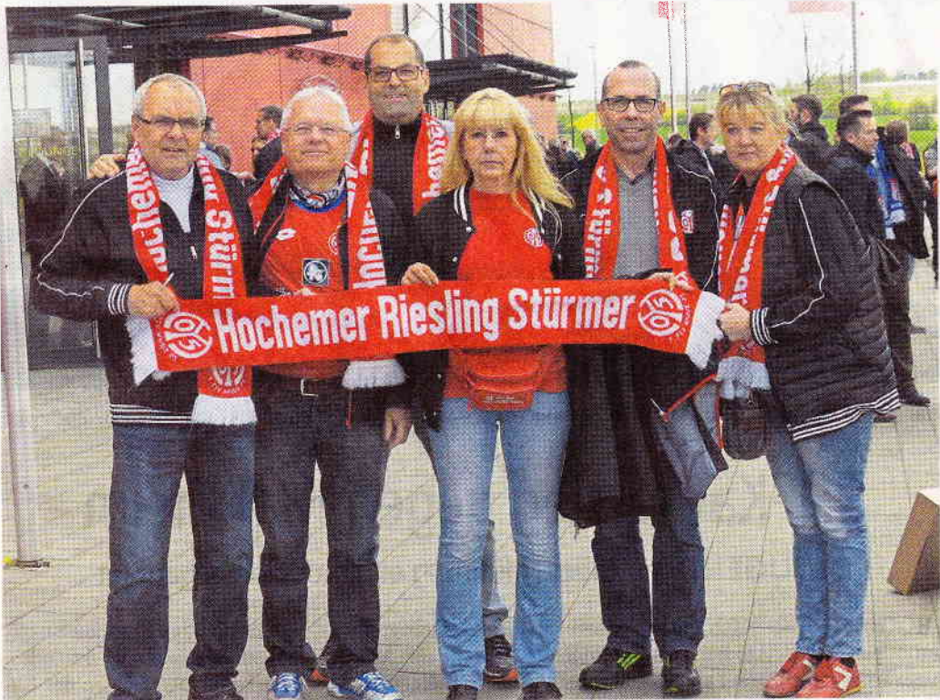
Die Hocheimer Riesling Stürmer nach ihrem 4:1-Erfolg im Torwandschießen.