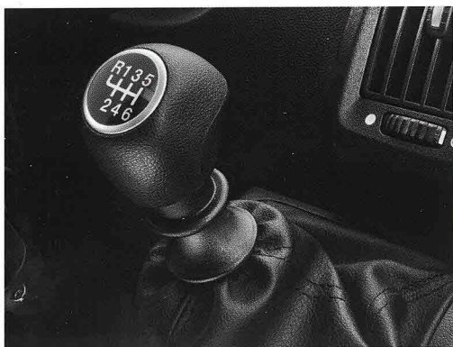
Mit neuem 6-Gang-Getriebe, das auch bei hoher Belastung, bei Anfahrten am Berg und bei gemischten Strecken unmittelbar und geräuscharm reagiert und lange, ruhige Fahrten ermöglicht.

Mit diesen Funktionen kombiniert Comfort-Matic die optimalen Fahrleistungen und die niedrigen Verbrauchswerte eines mechanischen Schaltgetriebes mit der Bedienfreundlichkeit und dem Komfort eines Automatikgetriebes. Das Ergebnis: Sie sitzen noch entspannter und sorgloser hinter dem Steuer des Fiat Ducato.