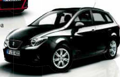
SEAT Ibiza ST Kombi Copa