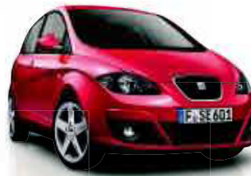
SEAT Altea Copa