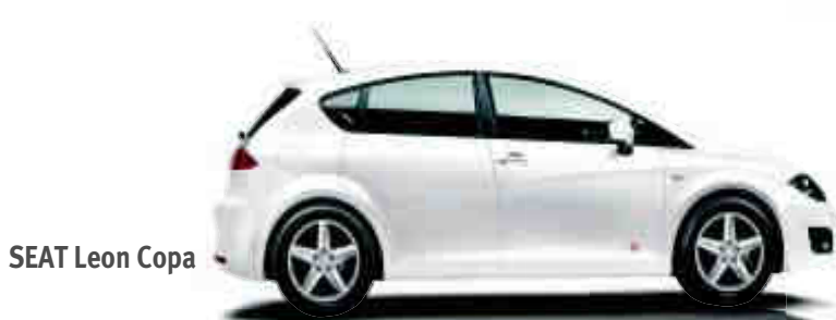
SEAT Leon Copa