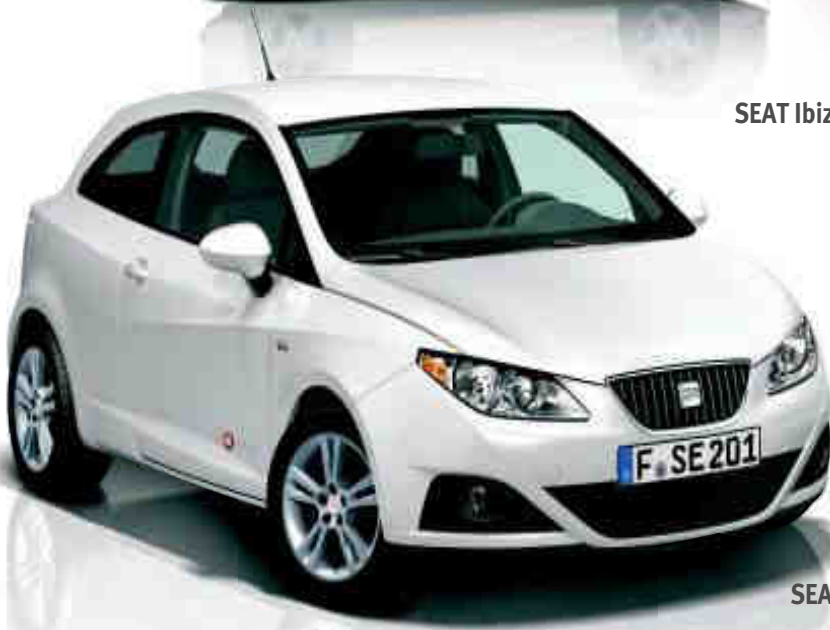
SEAT Ibiza SC Copa