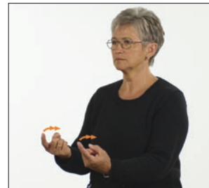
Versuchung, Versuchung * versuchen