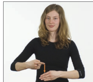
tägliches Tag * täglich