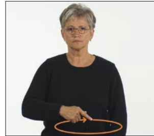
unser [im] alle * uns * unser * wir