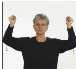
[und die] Kraft Kraft religiös