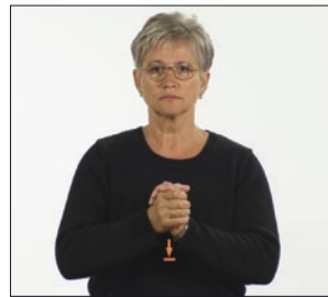
vergeben Vergebung * vergeben * Versöhnung * versöhnen