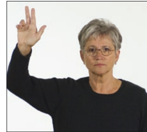
Dein Gott * Allmächtiger * Vater religiös