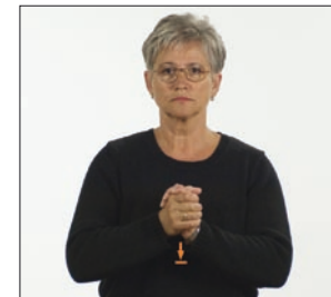
vergib Vergebung * vergeben * Versöhnung * versöhnen