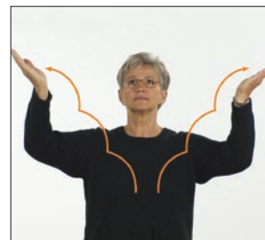
[und die] Herrlichkeit Herrlichkeit