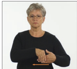
[Und] führe führen