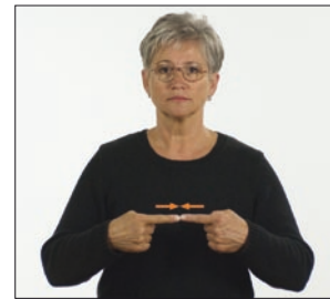
Schuldigen. Schuldiger * Gegner