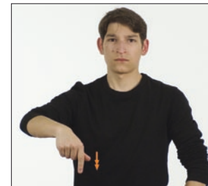
heute [und] heute * hier * jetzt