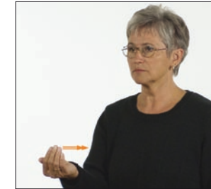
komme, kommen * komme