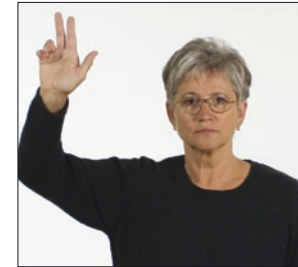
Dein Gott * Allmächtiger * Vater religiös