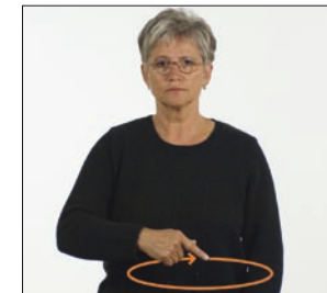
uns [unsere] alle * uns * unser * wir