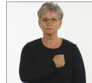
[dem] Bösen! Schuld * böse religiös * Sünde