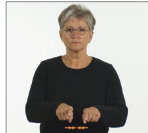
wie [im] gleich * wie