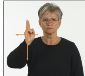
geheilig [werde] Kreuz * heilig