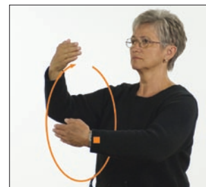
[in] Ewigkeit, Ewigkeit * ewig