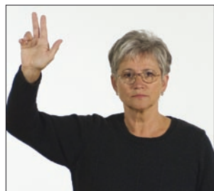
[Denn] Dein Gott * Allmächtiger * Vater religiös