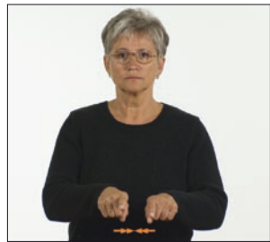
wie [auch] gleich * wie