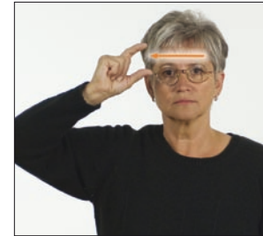
Name, Name * heißen