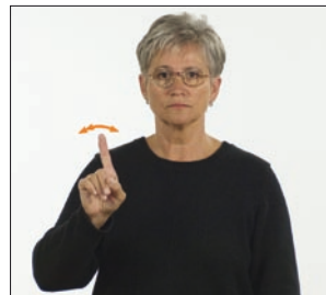
nicht [in] nicht * nein * kein