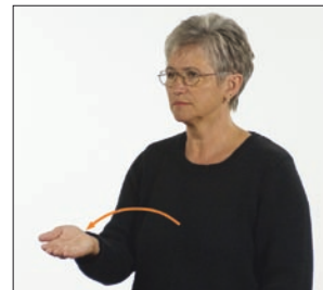
gib geben * abgeben * schenken