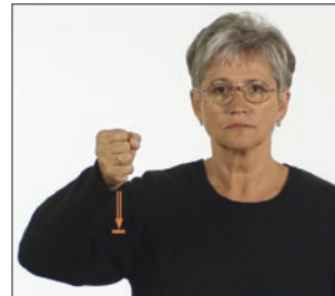
Wille Wille * will