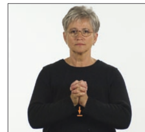
Amen. « Amen