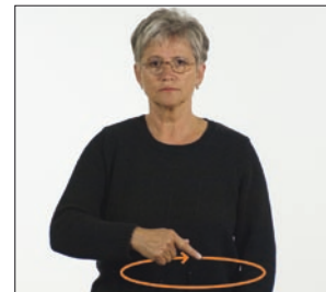
uns alle * uns * unser * wir