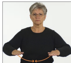
[ist das] Reich Reich