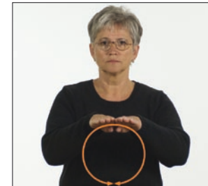
Erden! Ball * Erdball * Weltkugel