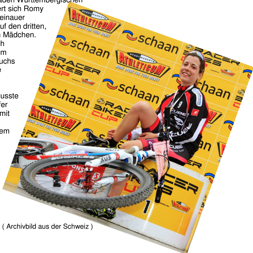
( Archivbild aus der Schweiz )

Wir drücken die Daumen und wünschen Viel Spaß.